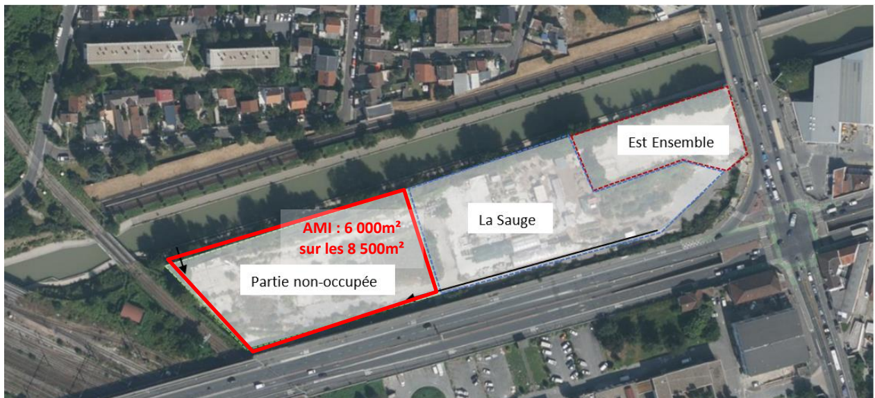
Figure 1 : périmètre de l'AMI

Image satellite avec localisation du site :